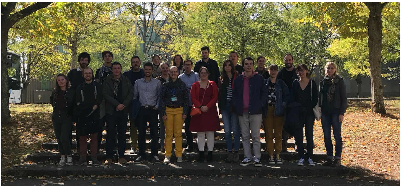
22 des 40 participants aux journées TEBIS 2022, à l'Université de Poitiers